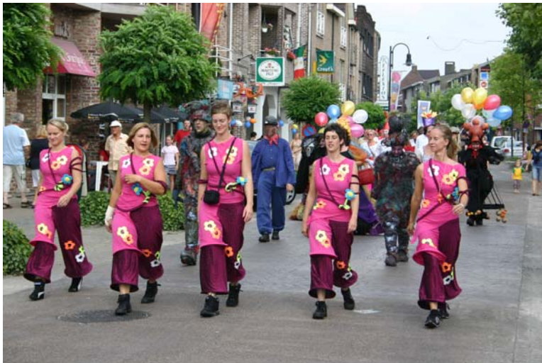
Katan uit Houthalen-Helchteren