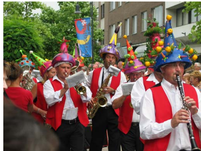
Noot per Noot