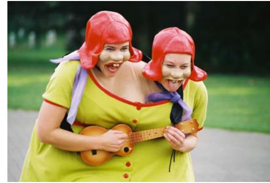
The Twins uit Australië