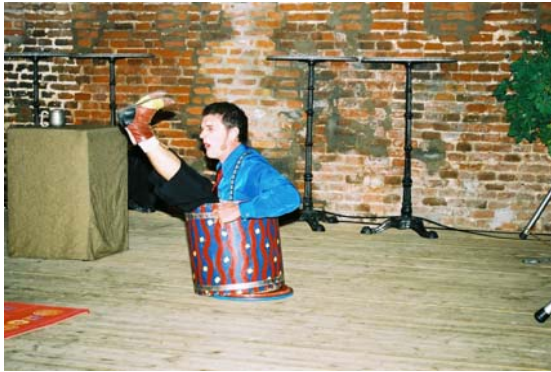
Bardo uit Canada