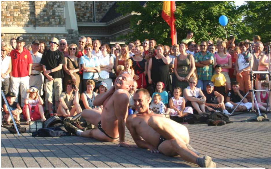
Skate Naked uit Groot-Brittannië

Een andere topper was het Franse l'Acte Théâtral, een vijftienkoppig gezelschap, met een totaalspektakel vol drama en humor in een mobiel decor. Aan de hand van een tunnel (nee, niet de onze!) vertelden deze artiesten hun levensverhaal.