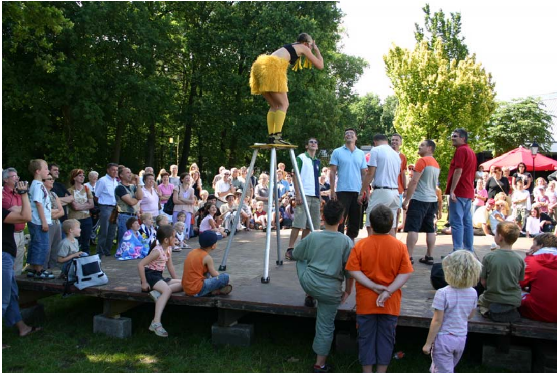
Lady Sunflower uit Australië

Het aantal locaties waar te lachen viel werd dit jaar uitgebreid dankzij de nieuwe wijkwerking. Het ILF trok voor het eerst, in samenspraak met het lokale verenigingsleven, de wijken en de buurten in, waarbij Lillo ging lopen met de titel van Plezantste Wijk!