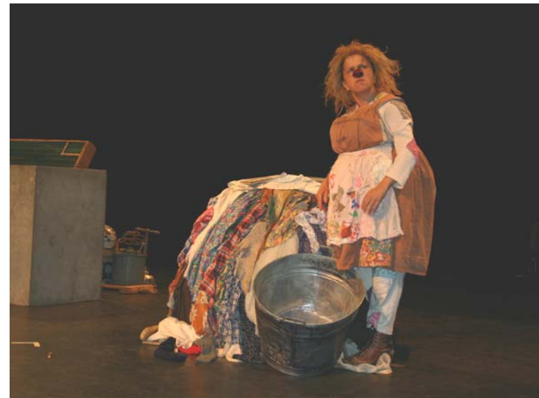
Gardi Hutter uit Zwitserland